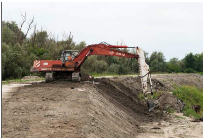
Immagine rappresentativa dell'attività di formazione del rilevato arginale

Descrizione dell'attività: Trattasi di formazione di rilevato arginale con fornitura e posa di terreno movimentato in loco e/o proveniente da cava privata, mediante autocarri e idonei mezzi meccanici posizionati a terra.