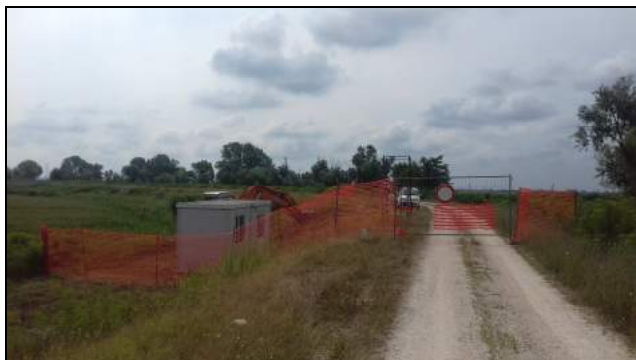
Immagine rappresentativa dell'attività di allestimento del cantiere

Descrizione dell'attività: Trattasi di effettuare una ricognizione preventiva dei luoghi, l'allestimento delle vie di circolazione interne del cantiere, la posa della segnaletica di sicurezza, l'interclusione dell'accesso a persone e mezzi non autorizzati nel cantiere, la pulizia della vegetazione infestante di disturbo per l'impianto del cantiere e l'esecuzione delle lavorazioni.