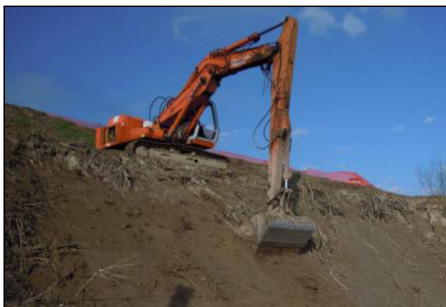
Immagine rappresentativa dell'attività di regolarizzazione della scarpata

Descrizione dell'attività: Trattasi di rifilo e regolarizzazione della scarpata arginale a fiume o del piano golenale, da eseguirsi mediante idonei mezzi meccanici posizionati a terra;