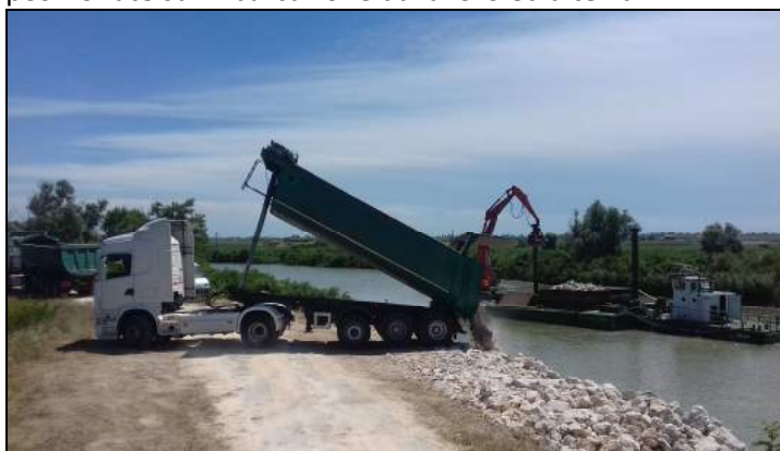
Immagine rappresentativa dell'attività di fornitura del pietrame