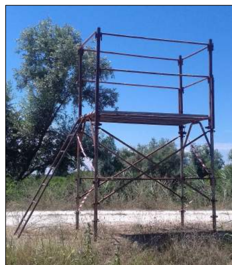
Immagine rappresentativa piattaforma

L’elemento dovrà essere ubicato nel cantiere, adeguatamente delimitato, presegnalato in posizione tale da non creare ostacolo alle attività di cantiere, preventivamente concordata con il CSE e la D.L.