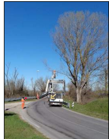
Immagini rappresentative dell'attività di taglio piante