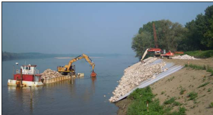
Immagine rappresentativa dell'attività di posa in opera del pietrame