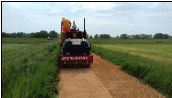
Immagini rappresentative dell'attività di regolarizzazione di rampe e percorsi