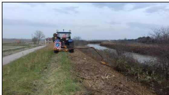
Immagini rappresentative della attività di taglio della vegetazione