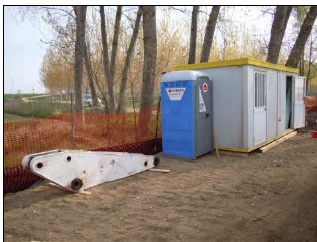
Immagine rappresentativa dell'attività di allestimento servizi di cantiere

Descrizione dell'attività: Il lavoro consiste nell'individuare ed e delimitare le aree per il stoccaggio provvisorio dei materiali da impiegare per la realizzazione dell'opera, il stoccaggio del materiale ed attrezzature, la posa di elementi prefabbricati (es. box prefabbricati per uffici e servizi) da installare nell'area destinata. Si precisa che durante la fase propedeutica per la preparazione del cantiere (1a), gli operatori devono aver provveduto alla pulizia delle zone destinate alla collocazione dei prefabbricati.